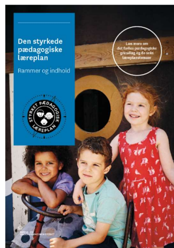
Den styrkede pædagogiske læreplan. Rammer og indhold